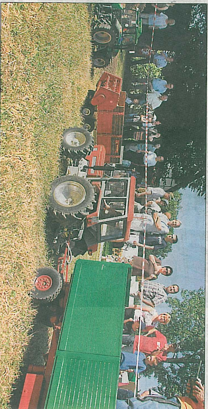
Alles, was der Große kann, schafft auch das Modell: Die Miniaturschlepper im Maßstab eins zu zehn fahren, durchpflügen den Acker und transportieren Gülle oder Getreide. Die zahlreichen Besucher sind fasziniert.

Bis zu 4000 Euro verschlingt das Material für ein Modell. Meist schraubt Horst Glaum einen ganzen Winter an einem